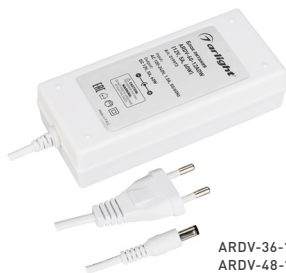
ARDV-36-12ADW ARDV-48-12ADW ARDV-60-12ADW

➤ Настольные сетевые адаптеры в пластиковом корпусе