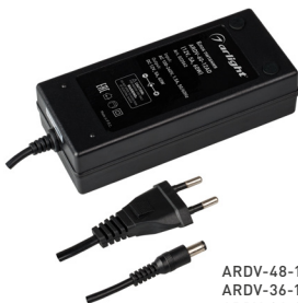
ARDV-48-12AD ARDV-36-12AD ARDV-36-24AD ARDV-60-12AD